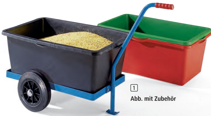
1 Abb. mit Zubehör