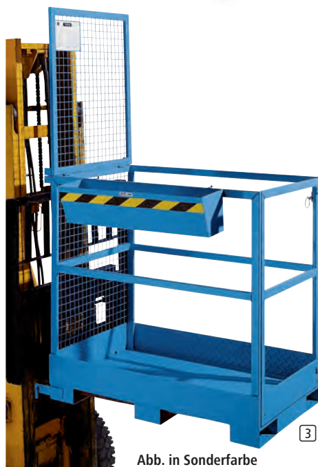
Abb. in Sonderfarbe